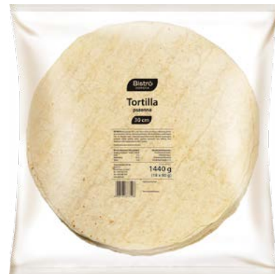
Tortilla 30 cm

gramatura 18 x 60 g EAN 5 902 162 328 211 szt. w opak. zb. 6 szt. na warstwie 36