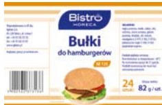
Bułka do hamburgera SE125

gramatura 82 g EAN 5 902 162 373 136 szt. w opak. zb. 24 szt. na warstwie 96