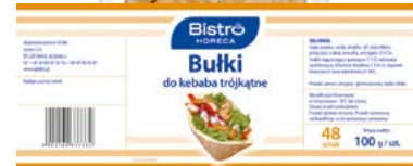
Bułka trójkątna do kebaba 19x19 cm

gramatura 100 g EAN 5 902 162 373 334 szt. w opak. zb. 48 (6 x 8 szt.) szt. na warstwie 336