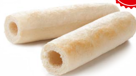
Bułka HOT-DOG francuski 40 g

gramatura 3 kg EAN 5 902 162 387 812 szt. w opak. zb. 1 szt. na warstwie 12