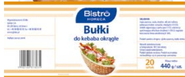
Bułka okrągła do kebaba ø29 cm

gramatura 440 g EAN 5 902 162 373 235 szt. w opak. zb. 20 (10 x 2 szt.) szt. na warstwie 120