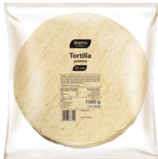
Tortilla 25 cm

gramatura 100 g EAN 5 902 162 373 334 szt. w opak. zb. 48 (6 x 8 szt.) szt. na warstwie 336