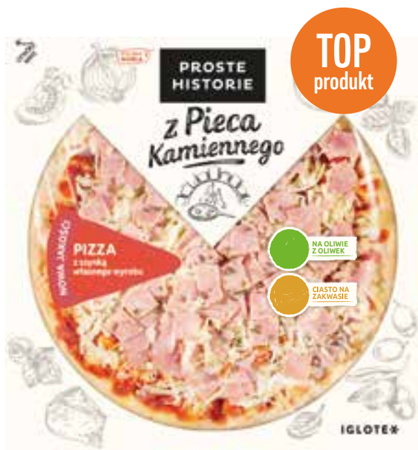
Pizza z szynką własnego wyrobu 390 g (6 szt.)