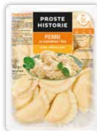
Pierogi ze szpinakiem i fetą 360 g (10 szt.)