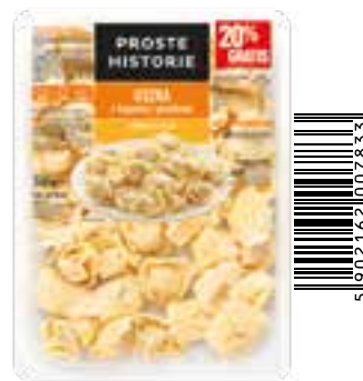
Uszka z kapustą i grzybami 360 g (10 szt.)