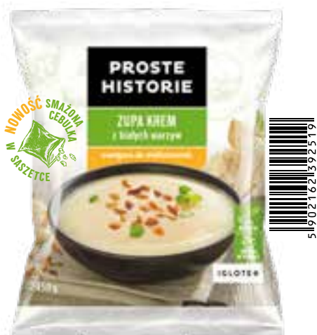
Zupa krem z białych warzyw 450 g (14 szt.)

Przełomowa linia zup kremów PROSTE HISTORIE z oryginalnymi dodatkami wzbogacającymi smak i pożywność posiłku to warzywa w nowoczesnym wydaniu. Każdy znajdzie dla siebie odpowiedni do nastroju czy też smaku kolor: łagodny zielony, delikatny biały, radosny żółty oraz energiczny czerwony. Gotujemy kolorami!