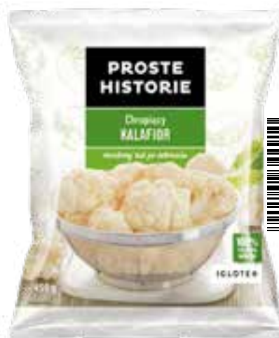
Chrupiący kalafior różyczki 450 g (14 szt.)