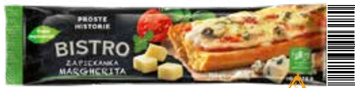
Zapiekanka margherita 190 g (20 szt.)