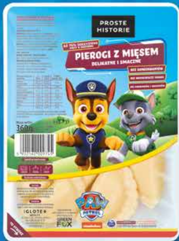
PSI PATROL Pierogi z mięsem 360 g (10 szt.)