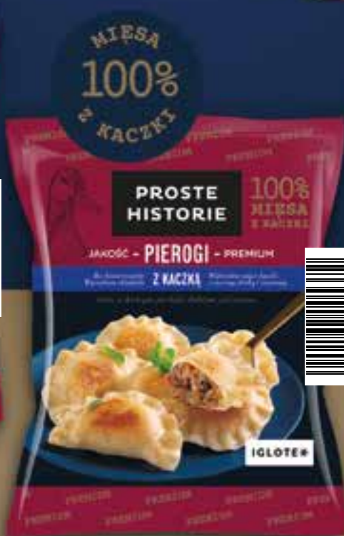
Pierogi z kaczką Premium 400 g (14 szt.)