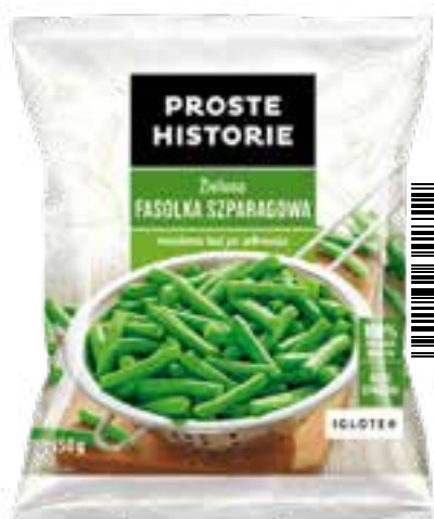
Zielona fasolka szparagowa cięta 450 g (14 szt.)