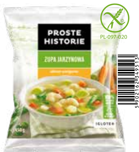
Zupa jarzynowa 450 g (14 szt.)

Składniki: marchew, pietruszka, ziemniaki, fasola szparagowa, kalafior, groch zielony, por, seler.