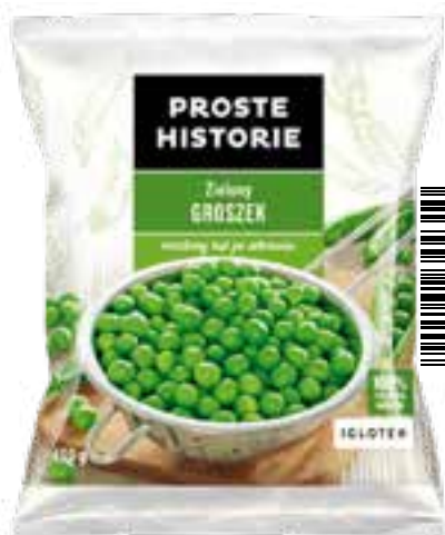
Zielony groszek 450 g (14 szt.)