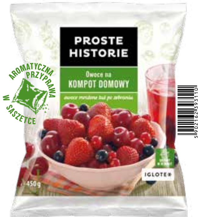
Kompot domowy 450 g (14 szt.)

Składniki: truskawki, wiśnie bez pestek, porzeczki czerwone, porzeczki czarne, aromatyczna przyprawa.