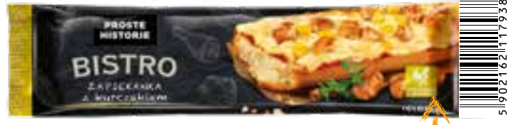
Zapiekanka z kurczakiem 200 g (20 szt.)