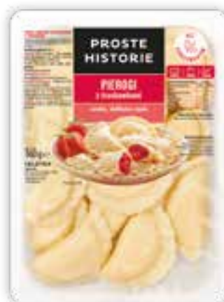
Pierogi z truskawkami 360 g (10 szt.)