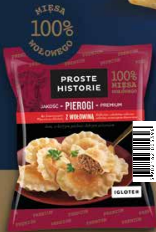
Pierogi z wołowiną Premium 400 g (14 szt.)