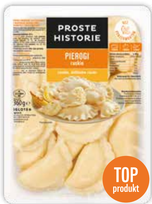
Pierogi ruskie 360 g (10 szt.)