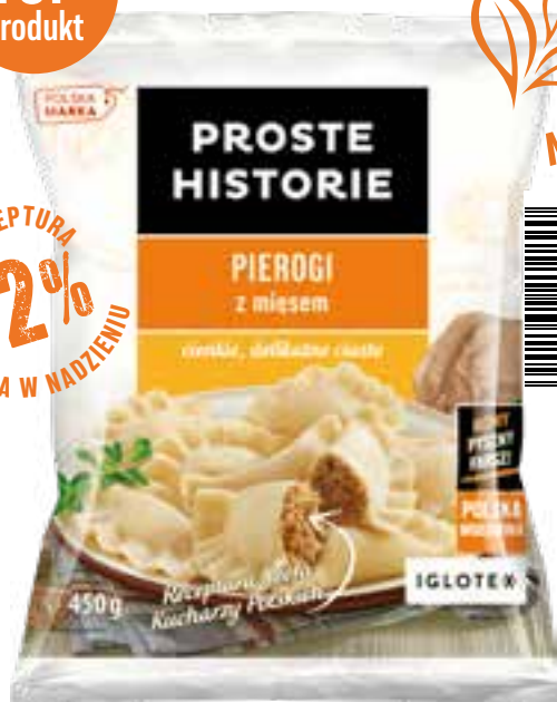
Pierogi z mięsem 450 g (14 szt.)

Pierogi PROSTE HISTORIE to klasyczne danie polskiej kuchni. Cienkie i delikatne ciasto, wyjątkowy smak i bogactwo nadzienia to nasza wizytówka. Amatorów klasycznych smaków zachwycą PIEROGI Z MIĘSEM z 72% zawartością mięsa w nadzieniu. Ofertę domowych dań uzupełniają tradycyjne pyzy, kluski i kartacze. Smak domowej tradycji!