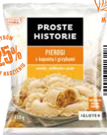
Pierogi z kapustą i grzybami 450 g (14 szt.)