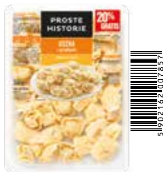
Uszka z grzybami 360 g (10 szt.)