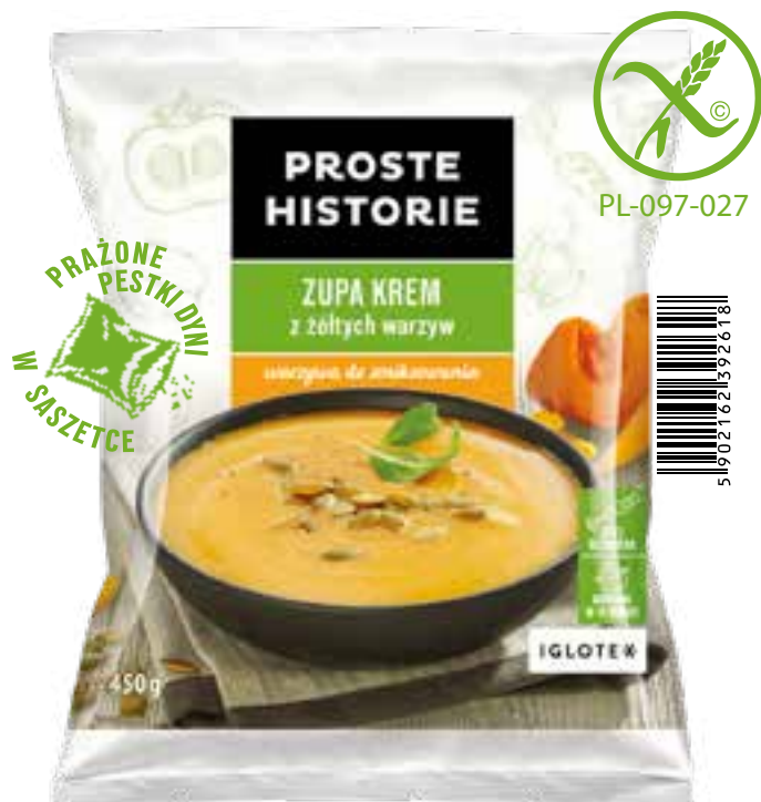
Zupa krem z żółtych warzyw 450 g (14 szt.)

Składniki: dynia, marchew żółta, marchew pomarańczowa, papryka żółta, pietruszka, seler, prażone pestki dyni.