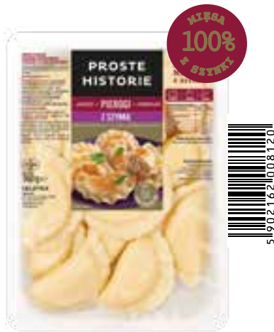
Pierogi PREMIUM z szynką 360 g (10 szt.)

Doceniasz jakość? Świetnie! Bo właśnie z wyszukanych składników stworzyliśmy pyszne, a jednocześnie wykwintne danie. Przed Tobą pierogi, które cechuje prosty skład i delikatne ciasto pełne smakowitego mięsa kaczki. Do tego suszona śliwka i żurawina, jabłko, cebulka i aromatyczne przyprawy. Pierogi w jakości premium, teraz także w wersji chłodzonej – polecamy!