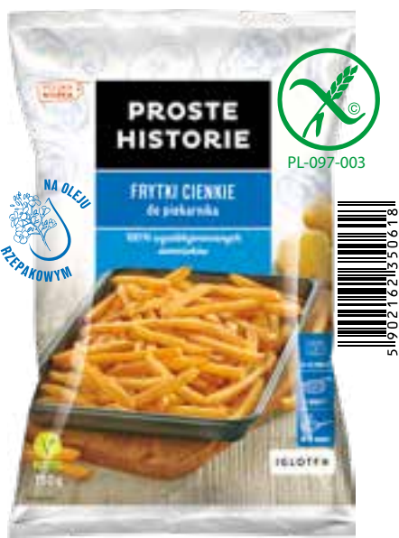
Frytki cienkie do piekarnika 750 g (12 szt.)

Produkty ziemniaczane PROSTE HISTORIE to niezwykle smaczne, chrupiące frytki, cząstki i talarki z polskich ziemniaków. Sporządzone ze specjalnych, wyselekcjonowanych odmian i podsmażone na oleju słonecznikowym. Na dodatek nie zawierają glutenu ani żadnych konserwantów . To naturalnie ziemniaczany, domowy smak każdego dnia. Proste i smaczne!