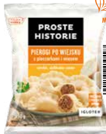
Pierogi po wiesku 450 g (14 szt.)