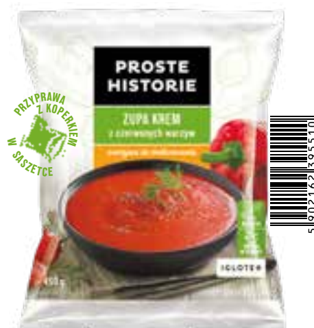
Zupa krem z czerwonych warzyw 450 g (14 szt.)

Składniki: brokuł, cukinia, groszek zielony, ziemniaki, cebula, szpinak, chrupki orkiszowe.