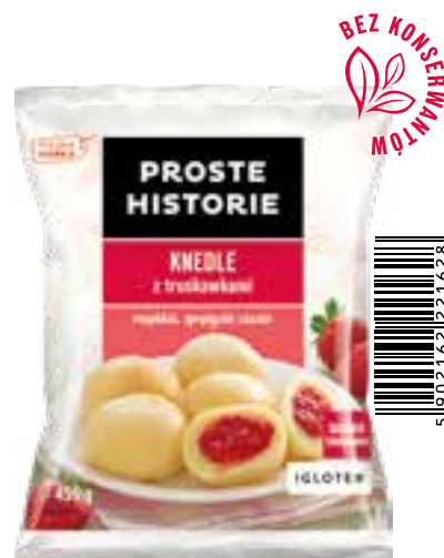
Knedle z truskawkami 450 g (14 szt.)