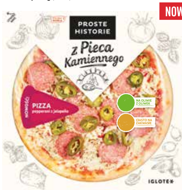
Pizza pepperoni z jalapeño 370 g (6 szt.)