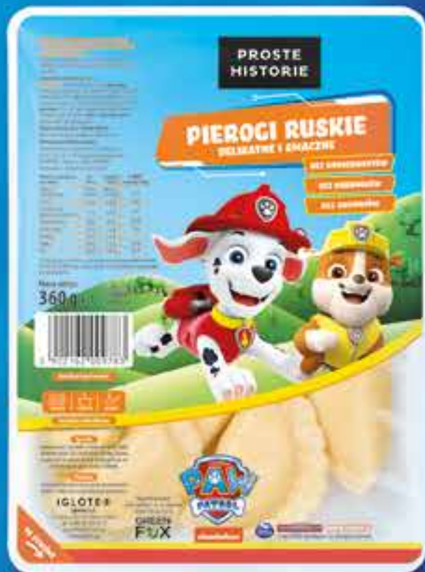
PSI PATROL Pierogi ruskie 360 g (10 szt.)