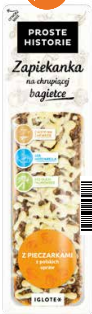
Zapiekanka z pieczarkami 255 g (8 szt.)