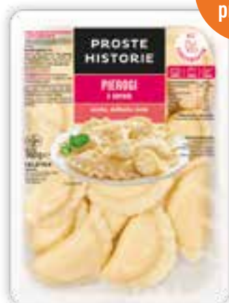
Pierogi z serem 360 g (10 szt.)