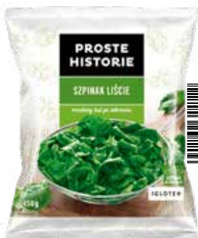
Szpinak liście 450 g (14 szt.)