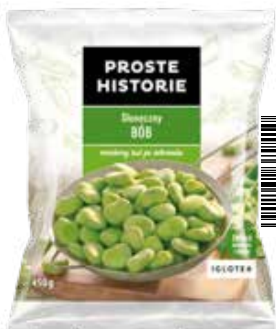
Słoneczny bób 450 g (14 szt.)