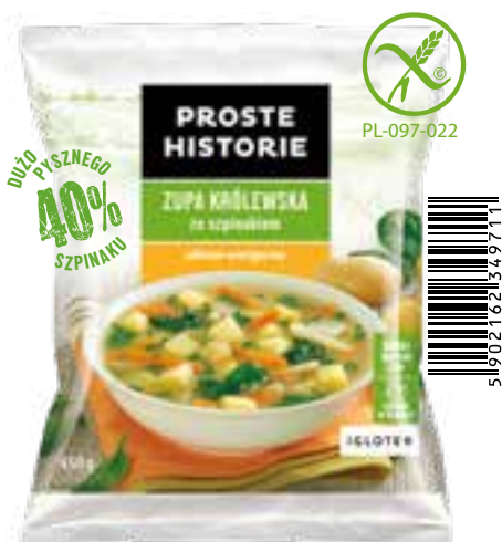
Zupa królewska ze szpinakiem 450 g (14 szt.)

Składniki: kalafior, marchew, ziemniaki, pietruszka, por, seler, koperek.