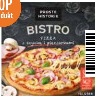
Pizza z szynką i pieczarkami 420 g (5 szt.)