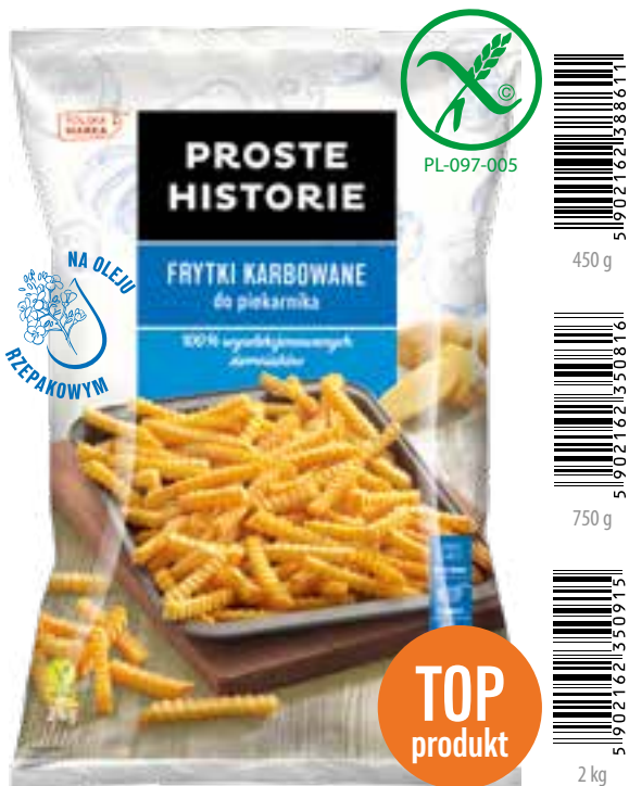
Frytki karbowane do piekarnika 450 g (14 szt.), 750 g (12 szt.), 2 kg (5 szt.)