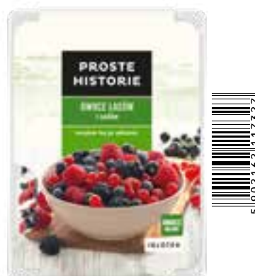
Owoce lasów i sadów 280 g (6 szt.)

Składniki: maliny, jeżyny, jagody, czarna porzeczka, czerwona porzeczka.