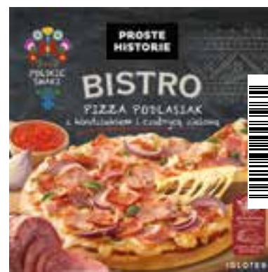
Pizza Podlasiak z kindziukiem i czubrycą zieloną 400 g (5 szt.)