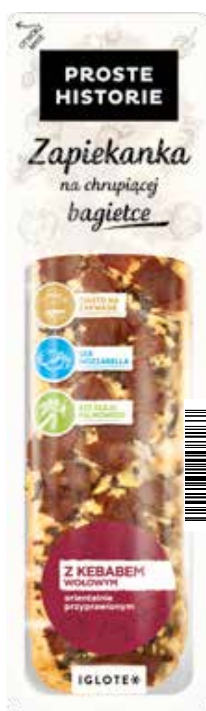
Zapiekanka z kebabem wołowym 255 g (8 szt.)