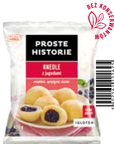
Knedle z jagodami 450 g (14 szt.)

Leniwe kluski PROSTE HISTORIE to pyszne kluseczki na bazie słodkiego sera twarogowego, które można przyrządzić w kilka minut, gotując lub smażąc na patelni czy we frytownicy. Natomiast sekret smaku klusek tkwi w soczystym i słodkim nadzieniu, które idealnie komponuje się z mięciutkim ciastem. Proste, słodkie specjały!