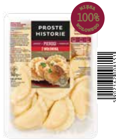
Pierogi PREMIUM z wołowiną 360 g (10 szt.)