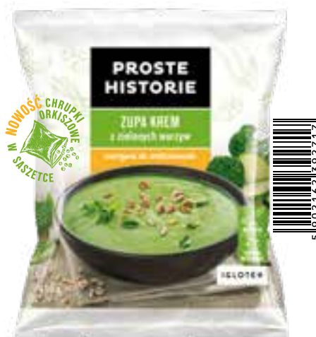
Zupa krem z zielonych warzyw 450 g (14 szt.)

Składniki: kalafior, pietruszka, ziemniaki, seler, smażona cebulka.