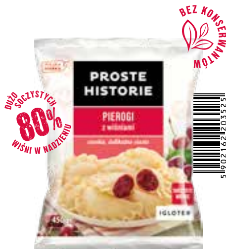
Pierogi z wiśniami 450 g (14 szt.)