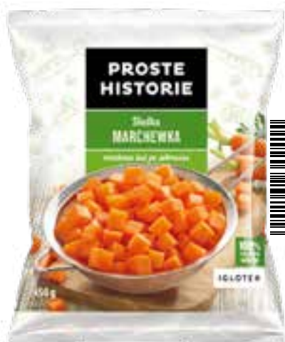
Słodka marchewka kostka 450 g (14 szt.)