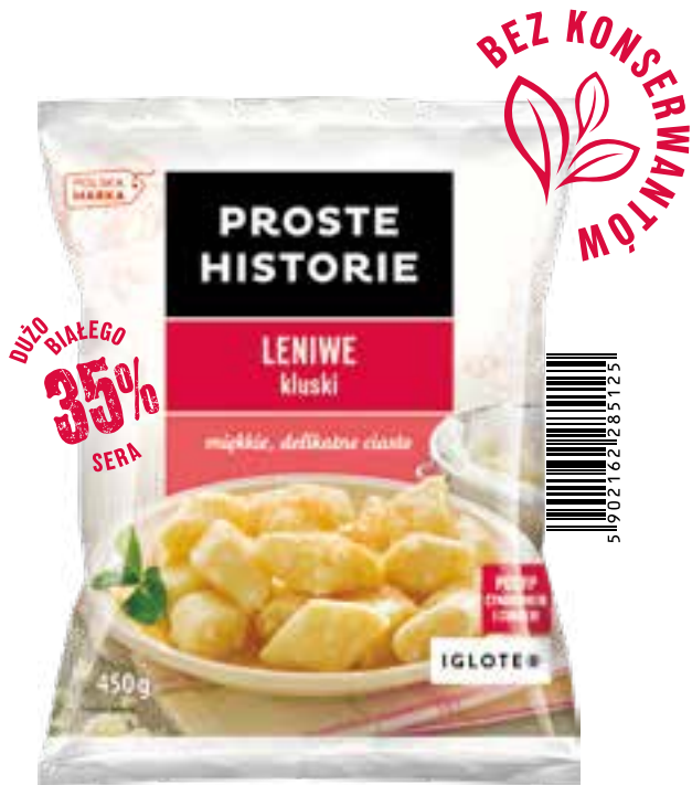
Leniwe kluski 450 g (14 szt.)

Leniwe kluski PROSTE HISTORIE to pyszne kluseczki na bazie słodkiego sera twarogowego, które można przyrządzić w kilka minut, gotując lub smażąc na patelni czy we frytownicy. Natomiast sekret smaku klusek tkwi w soczystym i słodkim nadzieniu, które idealnie komponuje się z mięciutkim ciastem. Proste, słodkie specjały!