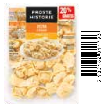
Uszka z mięsem 360 g (10 szt.)

*Dostępne w miesiącach: listopad i grudzień.