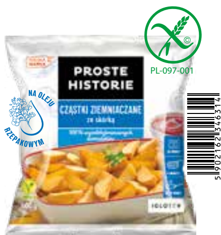
Cząstki ziemniaczane 600 g (16 szt.)