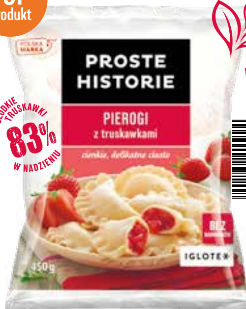
Pierogi z truskawkami 450 g (14 szt.)

Pierogi na słodko PROSTE HISTORIE to połączenie delikatnego i subtelnego ciasta z pysznym, słodkim nadzieniem. Leśne jagody, soczyste wiśnie i słodki ser gwarantują niezapomniane doznania. A dla najmłodszych proponujemy PIEROGI Z TRUSKAWKAMI, delikatne ciasto, a w środku... bogactwo najśłodszych truskawek. Prawdziwa rozkosz dla podniebienia!