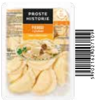
Pierogi z grzybami 360 g (10 szt.)