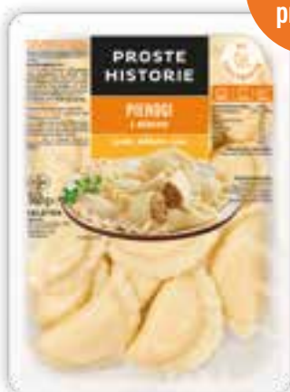
Pierogi z mięsem 360 g (10 szt.)