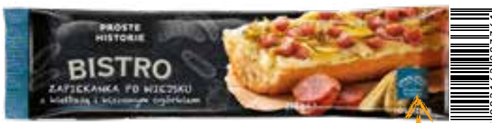
Zapiekanka po wiejsku 210 g (20 szt.)