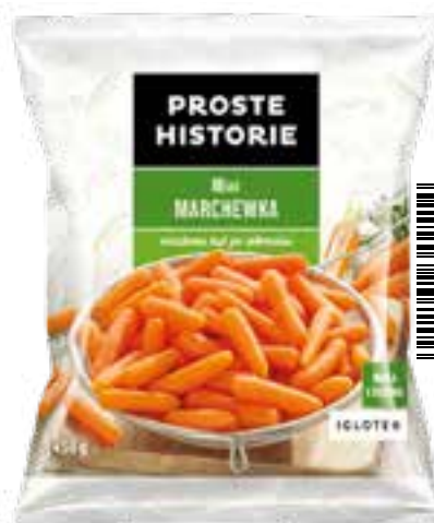
Mini marchewka 450 g (14 szt.)