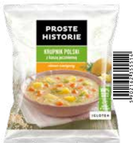
Krupnik polski z kaszą jęczmienną 450 g (14 szt.)

Składniki: szpinak, ziemniaki, cebula, marchew, seler.