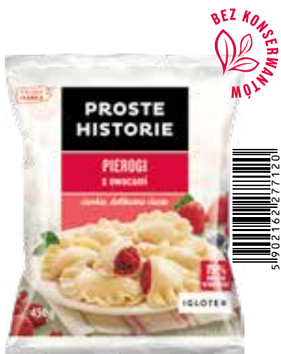
Pierogi z owocami 450 g (14 szt.)