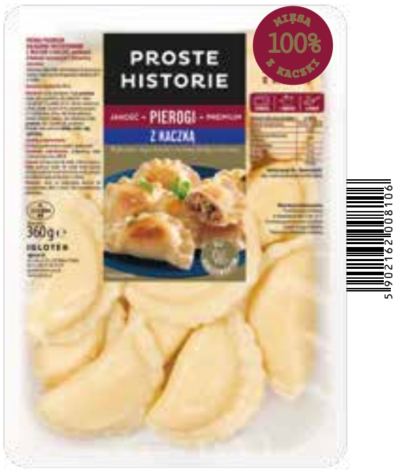
Pierogi PREMIUM z kaczką 360 g (10 szt.)

Doceniasz jakość? Świetnie! Bo właśnie z wyszukanych składników stworzyliśmy pyszne, a jednocześnie wykwintne danie. Przed Tobą pierogi, które cechuje prosty skład i delikatne ciasto pełne smakowitego mięsa kaczki. Do tego suszona śliwka i żurawina, jabłko, cebulka i aromatyczne przyprawy. Pierogi w jakości premium, teraz także w wersji chłodzonej – polecamy!