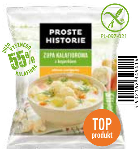
Zupa kalafiorowa z koperkiem 450 g (14 szt.)

Składniki: marchew, pietruszka, ziemniaki, fasola szparagowa, kalafior, groch zielony, por, seler.