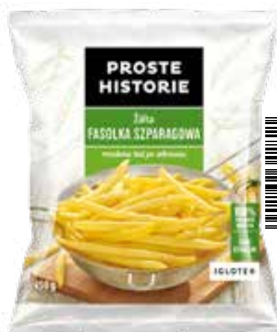
Żółta fasolka szparagowa cała 450 g (14 szt.)