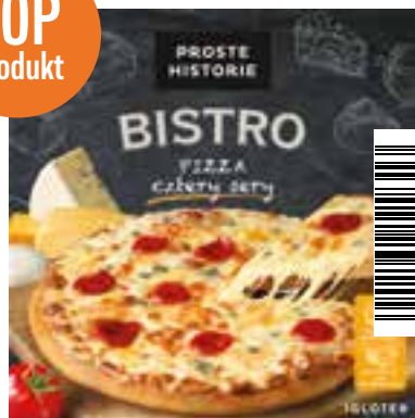
Pizza cztery sery 390 g (5 szt.)