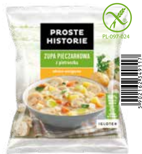
Zupa pieczarkowa z pietruszką 450 g (14 szt.)

Składniki: ogórek kiszony, ziemniaki, marchew, seler, cebula, pietruszka, koperek.