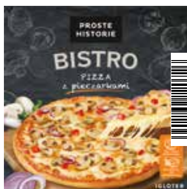
Pizza z pieczarkami 415 g (5 szt.)