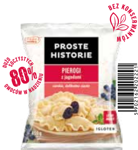
Pierogi z jagodami 450 g (14 szt.)

Pierogi na słodko PROSTE HISTORIE to połączenie delikatnego i subtelnego ciasta z pysznym, słodkim nadzieniem. Leśne jagody, soczyste wiśnie i słodki ser gwarantują niezapomniane doznania. A dla najmłodszych proponujemy PIEROGI Z TRUSKAWKAMI, delikatne ciasto, a w środku... bogactwo najśłodszych truskawek. Prawdziwa rozkosz dla podniebienia!