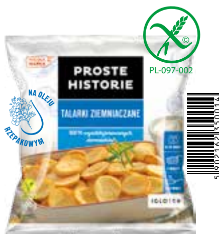
Talarki ziemniaczane 600 g (16 szt.)