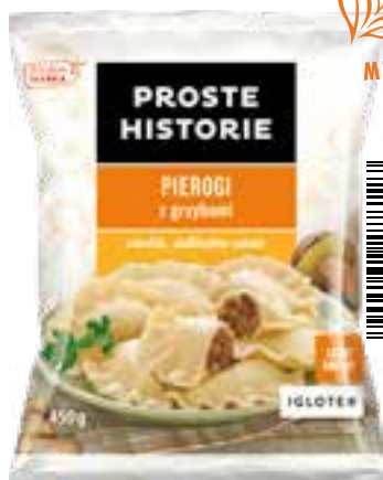
Pierogi z grzybami 450 g (14 szt.)