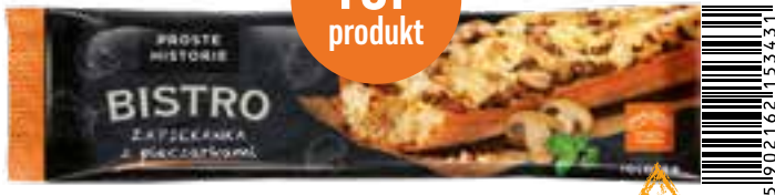
Zapiekanka z pieczarkami 200 g (20 szt.)