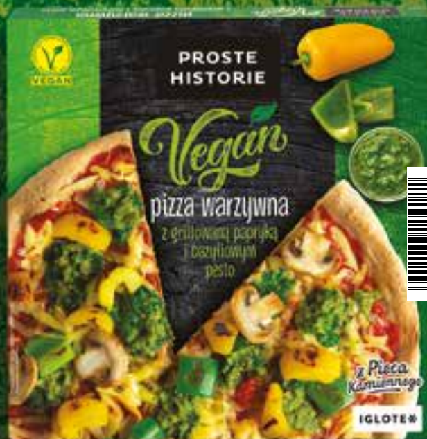
Pizza VEGAN Warzywna z grillowaną papryką i bazyliowym pesto 345 g (5 szt.)