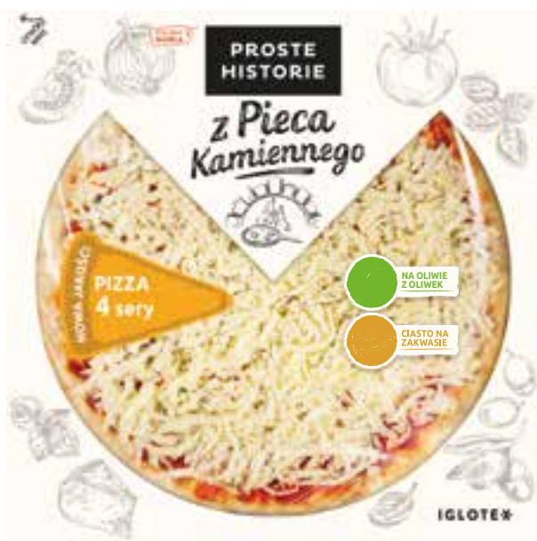
Pizza 4 sery 370 g (6 szt.)

Pizza chłodzona PROSTE HISTORIE z Pieca Kamiennego to absolutna nowość na rynku. To pizza wypiekana w sposób tradycyjny w piecu kamiennym. Jej podstawą jest cienkie i chrupiące ciasto na zakwasie oraz aromatyczny sos na bazie pomidorów i oliwy z oliwek. Wielbicieli klasycznych smaków zachwyci swym smakiem PIZZA Z SZYNKĄ WŁASNEGO WYROBU.