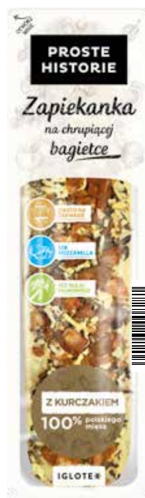
Zapiekanka z kurczakiem 255 g (8 szt.)