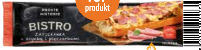
Zapiekanka z szynką i pieczarkami 200 g (20 szt.)

Szynka bez fosforanów, karagenów i wzmacniaczy smaku