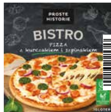
Pizza z kurczakiem i szpinakiem 435 g (5 szt.)