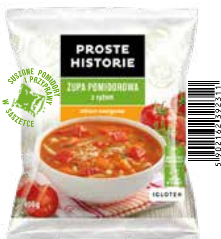
Zupa pomidorowa z ryżem 450 g (14 szt.)

Składniki: pieczarki, marchew, ziemniaki, cebula, pietruszka, natka pietruszki, por, seler.