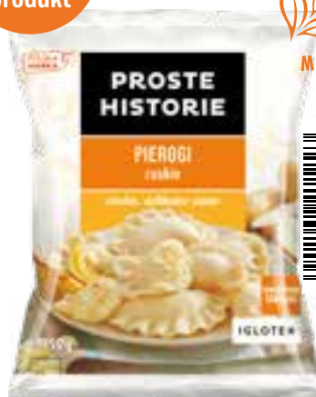
Pierogi ruskie 450 g (14 szt.)