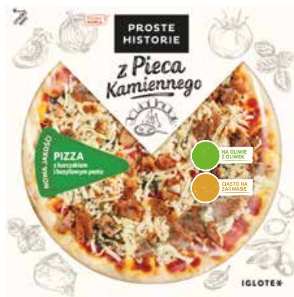
Pizza z kurczakiem i bazyliowym pesto 315 g (6 szt.)