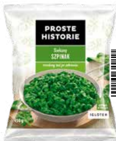
Siekany szpinak 450 g (14 szt.)