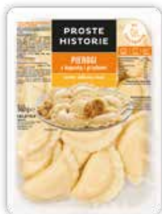
Pierogi z kapustą i grzybami 360 g (10 szt.)

Może dlatego, że przenoszą nas w świat prostej, polskiej kuchni, pełnej dań robionych z miłością. A może po prostu dlatego, że smakują jak nic innego! Zwłaszcza gdy nie zawierają konserwantów, barwników i aromatów oraz wzmacniaczy smaku. Miłośnikom klasycznych smaków polecamy PIEROGI RUSKIE, delikatny twaróg, ziemniaki i aromatyczna, smażona cebulka dają kompozycję, której nie sposób się oprzeć. Szybko się je przyrządza i jeszcze szybciej zjada.