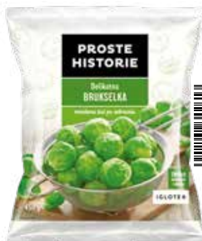
Delikatna brukselka 450 g (14 szt.)