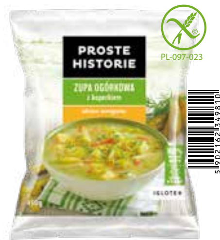
Zupa ogórkowa z koperkiem 450 g (14 szt.)

Składniki: ziemniaki, marchew, kasza jęczmienna, koperek.