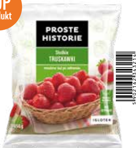
Słodkie truskawki bez szypulek 450 g (14 szt.)