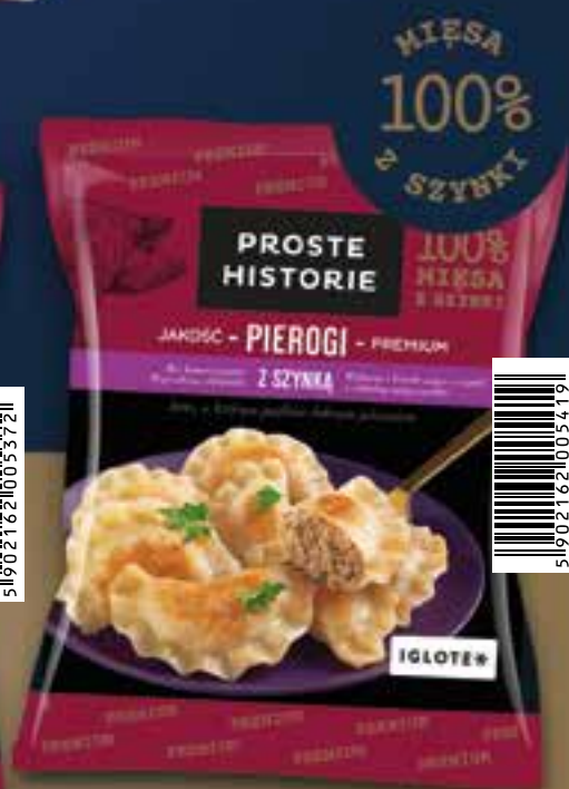
Pierogi z szynką Premium 400 g (14 szt.)