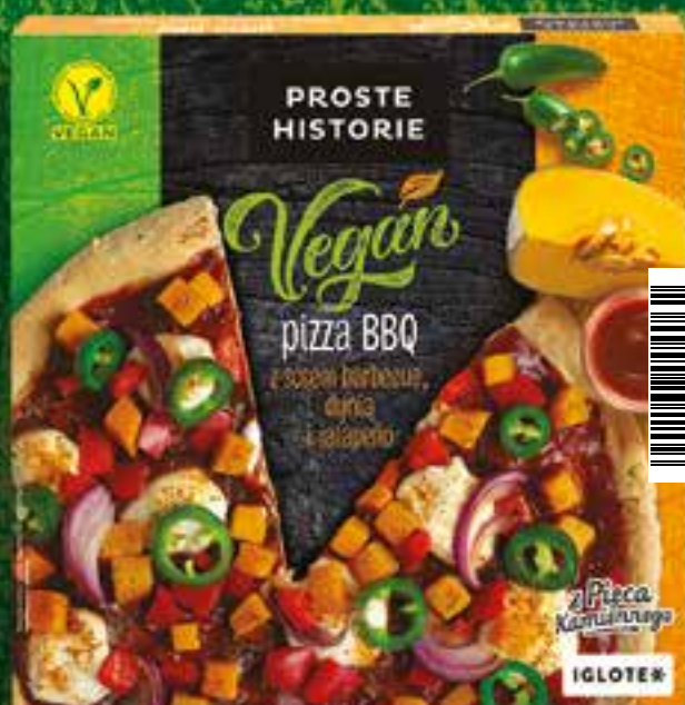
Pizza VEGAN BBQ z sosem barbecue, dynią i jalapeño 340 g (5 szt.)