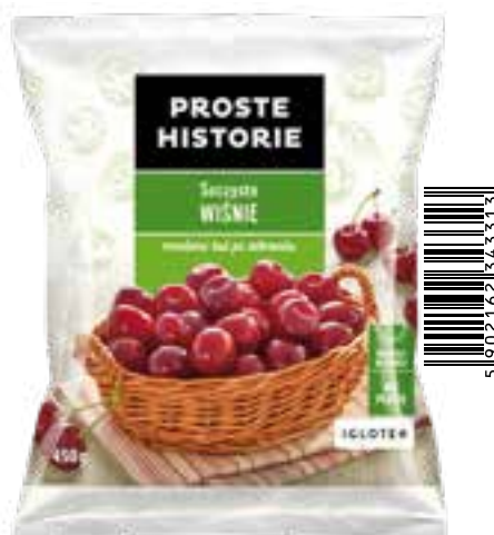
Soczyste wiśnie bez pestek 450 g (14 szt.)