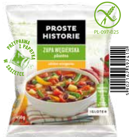
Zupa węgierska pikantna 450 g (14 szt.)

Składniki: pomidor, ryż, marchew, cebula, seler, pietruszka, koncentrat pomidorowy, mieszanka suszonych pomidorów i przypraw.