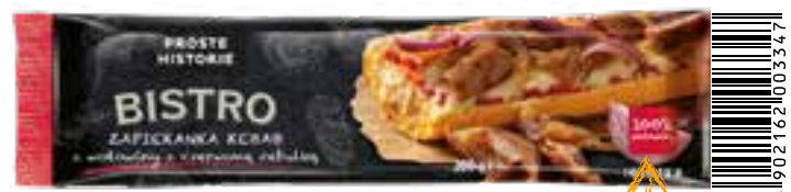
Zapiekanka kebab 200 g (20 szt.)