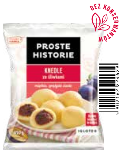
Knedle ze śliwkami 450 g (14 szt.)