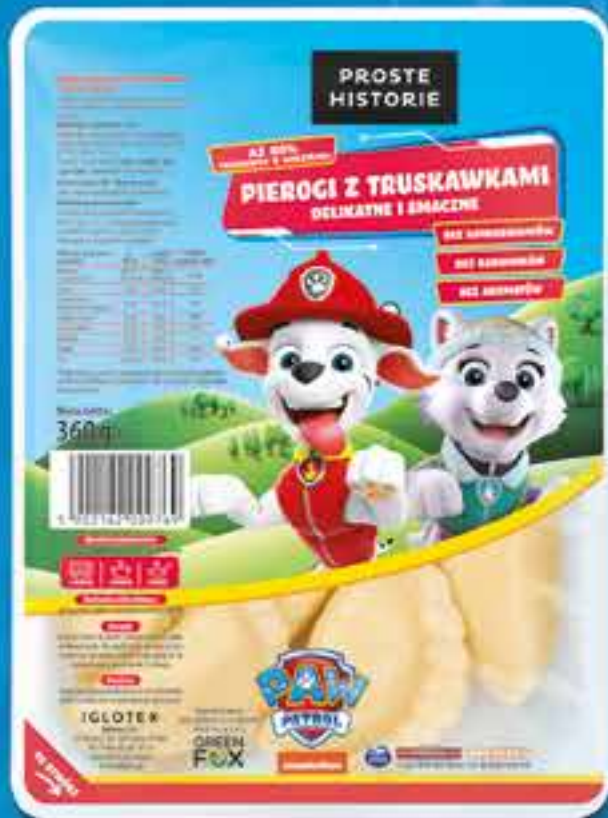
PSI PATROL Pierogi z truskawkami 360 g (10 szt.)