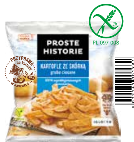
Kartofle ze skórą grubo ciosane 600 g (16 szt.)