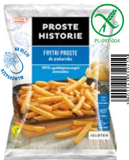
Frytki proste do piekarnika 750 g (12 szt.)