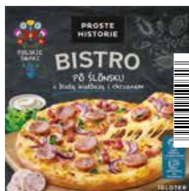
Pizza po śląsku z białą kielbasą i chrzanem 385 g (5 szt.)