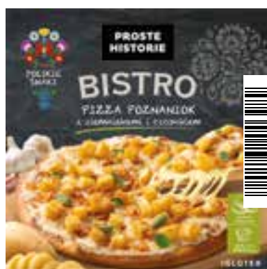
Pizza Poznaniok z ziemniakami i czosnkiem 385 g (5 szt.)