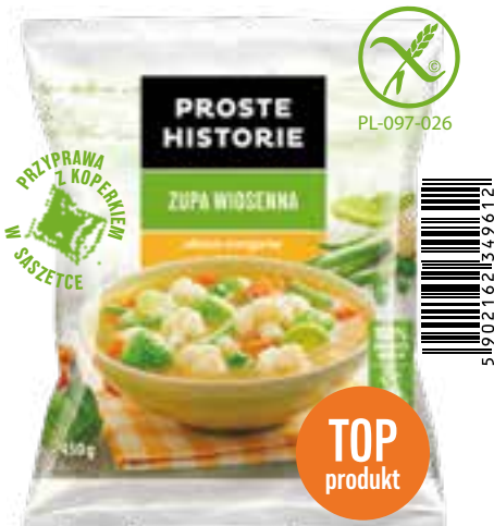
Zupa wiosenna 450 g (14 szt.)

Składniki: pomidor, papryka czerwona, ziemniaki, papryka żółta, fasola czerwona, fasola szparagowa zielona, cebula, przyprawa z papryką.