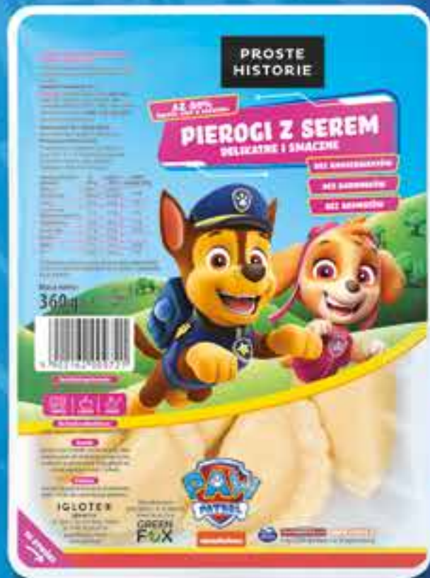
PSI PATROL Pierogi z serem 360 g (10 szt.)