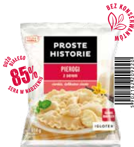
Pierogi z serem 450 g (14 szt.)