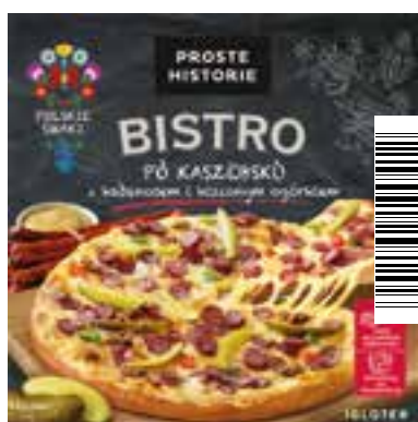
Pizza po kaszubsku z kabanosem i kiszonym ogórkiem 400 g (5 szt.)