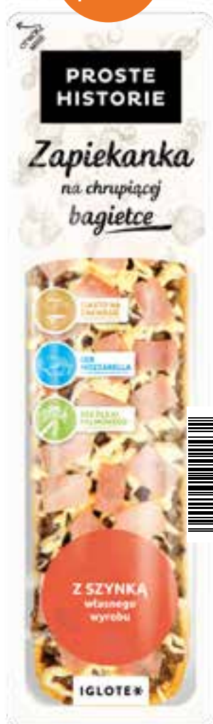
Zapiekanka z szynką 270 g (8 szt.)