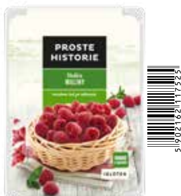
Słodkie maliny 280 g (6 szt.)