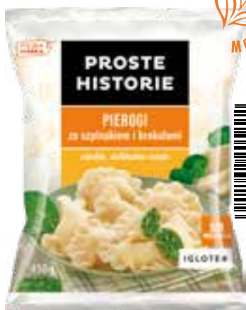
Pierogi ze szpinakiem i brokułami 450 g (14 szt.)